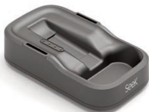
Chargeur de table (inclus)