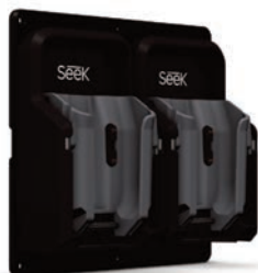
Chargeur véhiculaire double ou triple (non-inclus)