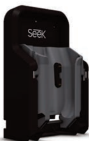
Chargeur véhiculaire simple (non-inclus)